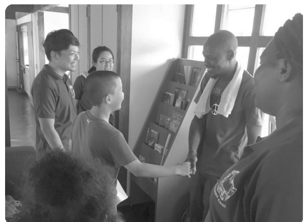
外国人に英語で質問する参加者たち

猛暑の中、多忙な中で都合をつけてお世話下さった多くのスタッフの方々、食事を作って下さったご婦人の方々有難うございました。