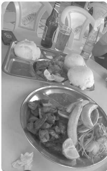
東アフリカの主食 ウガリと食事

らの出発と、アフリカの時間の流れと日本の時間通りに進むスケジュールに合わせた生活から始まっていること大きなギャップとストレスがあつたに違いない。その中でも様々な問題を抱