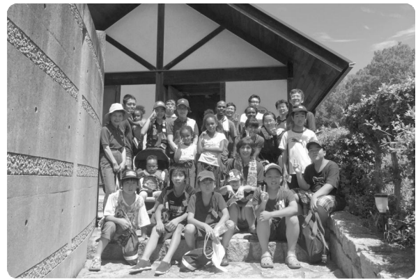
白石島の民宿のオーナー(タンザニア人)を囲んで