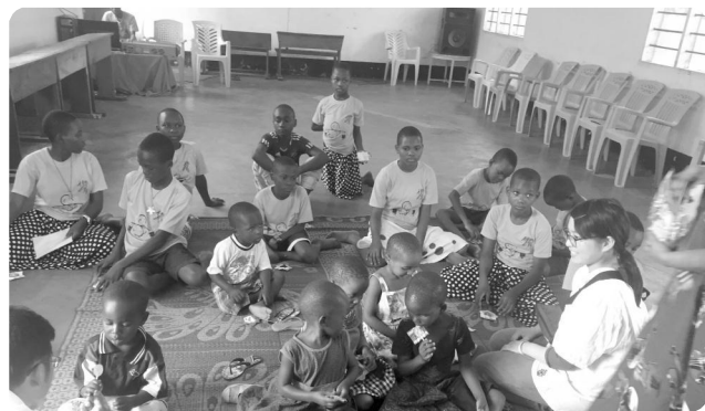
毎年訪問するアマニ孤児院。ジュース、小麦粉、文具などを寄贈させて頂いた

らの出発と、アフリカの時間の流れと日本の時間通りに進むスケジュールに合わせた生活から始まっていること大きなギャップとストレスがあつたに違いない。その中でも様々な問題を抱