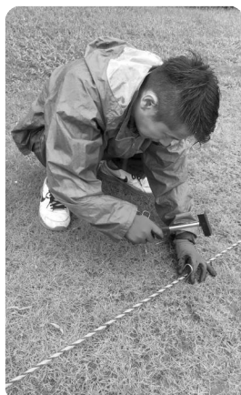
作業は丁寧に進められた