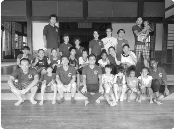
ゲストを囲んでの参加者、スタッフ

オリンピックが終了した10年後の2030年には、訪日観光客の数が「6、000万人」という目標を日本官公庁が掲げています。つまり日本は3人に1人が外国人になります。全員が日本